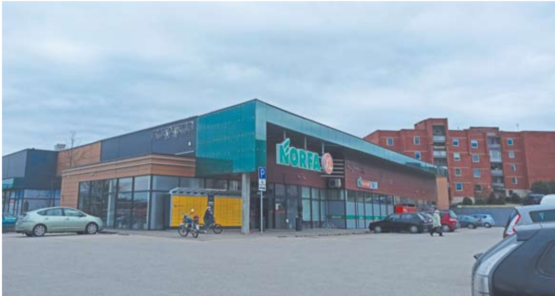
„Pepco“ parduotuvė įsikurs prekybos centro „Norfa“ patalpose Žiburio gatvėje.

Anykščiuose šį pavasarį duris planuoja atverti Lenkijos drabužių ir namų apyvokos prekių parduotuvė „Pepco“.