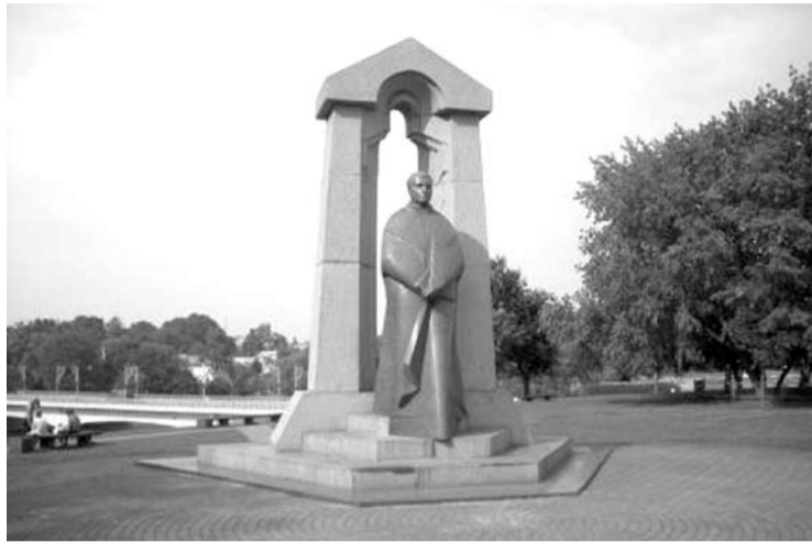
Pastebėta, kad poeto ir vyskupo Antano Baranausko paminklo grantiniai laiptai atšoko nuo pagrindo, todėl jie bus remontuojami.