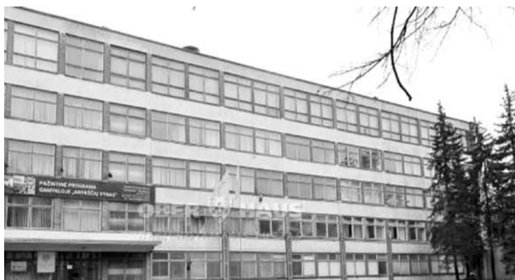
Pernai „Anykščių vyno“ gamykla iš vietos augintojų supirko apie 15 milijonų kilogramų obuolių.

„Pavyzdžiui, per 2020 metus „Anykščių vyno“ gamykla supirko apie 15 milijonų kilogramų obuolių iš Lietuvos. Ne visi supirkti obuoliai yra naudojami vien tik vaisių vyno gamybai, tačiau tokiam obuolių kiekiui supirkti buvo pasitelkti maždaug 65 skirtingi vietiniai ūkininkai ir supirkėjai. Gamykloje šiuo metu dirba daugiau nei 90 darbuotojų. Prasidėjus