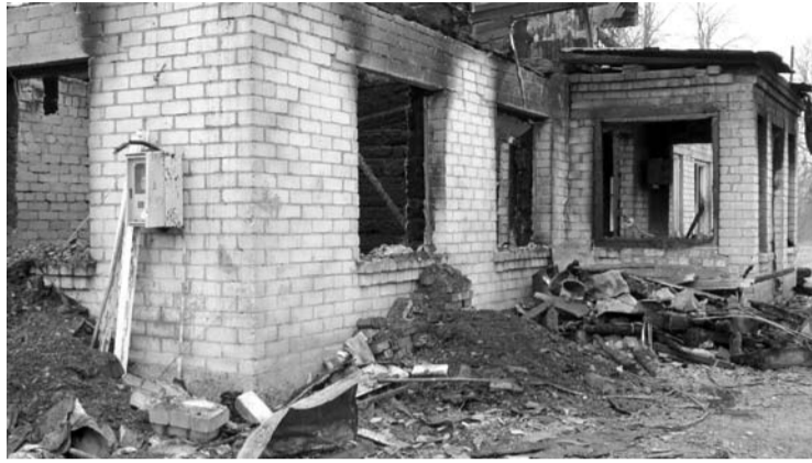
Medinį apmūrytą namą, kurio vidus buvo iškljuotas plastikinėmis dailylentėmis, ugnis sunaikino beveik visiškai.

ir trimis vaikais buvo antrajame pastato aukšte, kiti žmonės – pirmajame aukšte. Kad dega namai, jie išgirdo merginos riksmą iš pirmo aukšto.